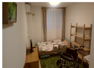
モデルルーム ※家具の備付はありません