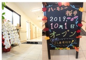
季節感のあるエントランスホールがお出迎え