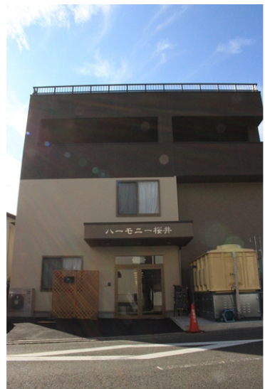
訪れる方々をお迎えする、温かな色合いが印象的な建物外観